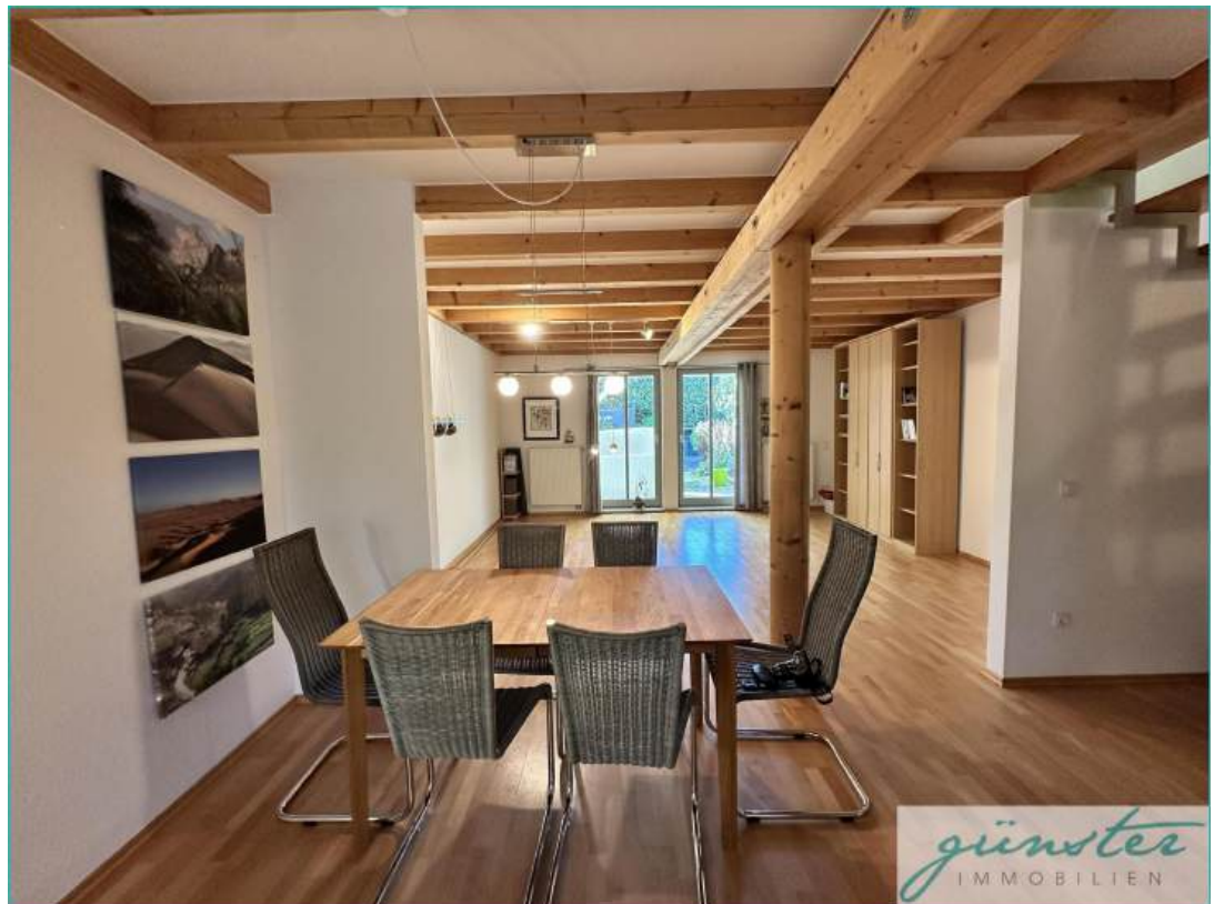
Essbereich mit Wohnzimmer