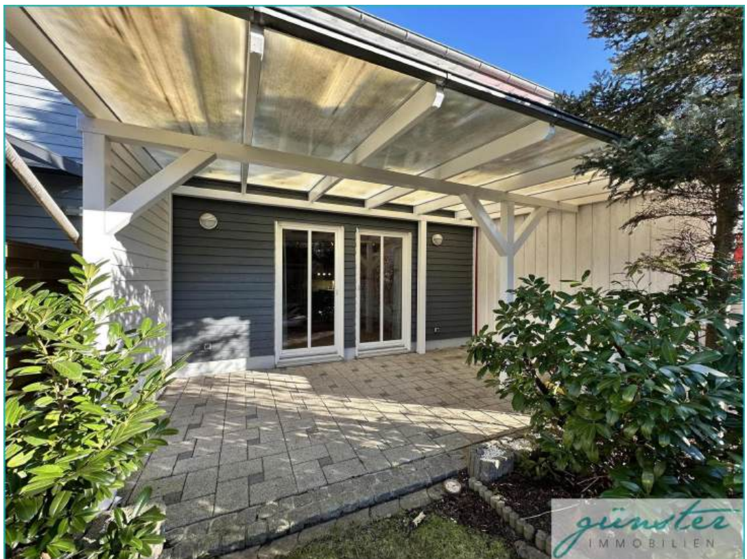
Terrasse mit Überdachung