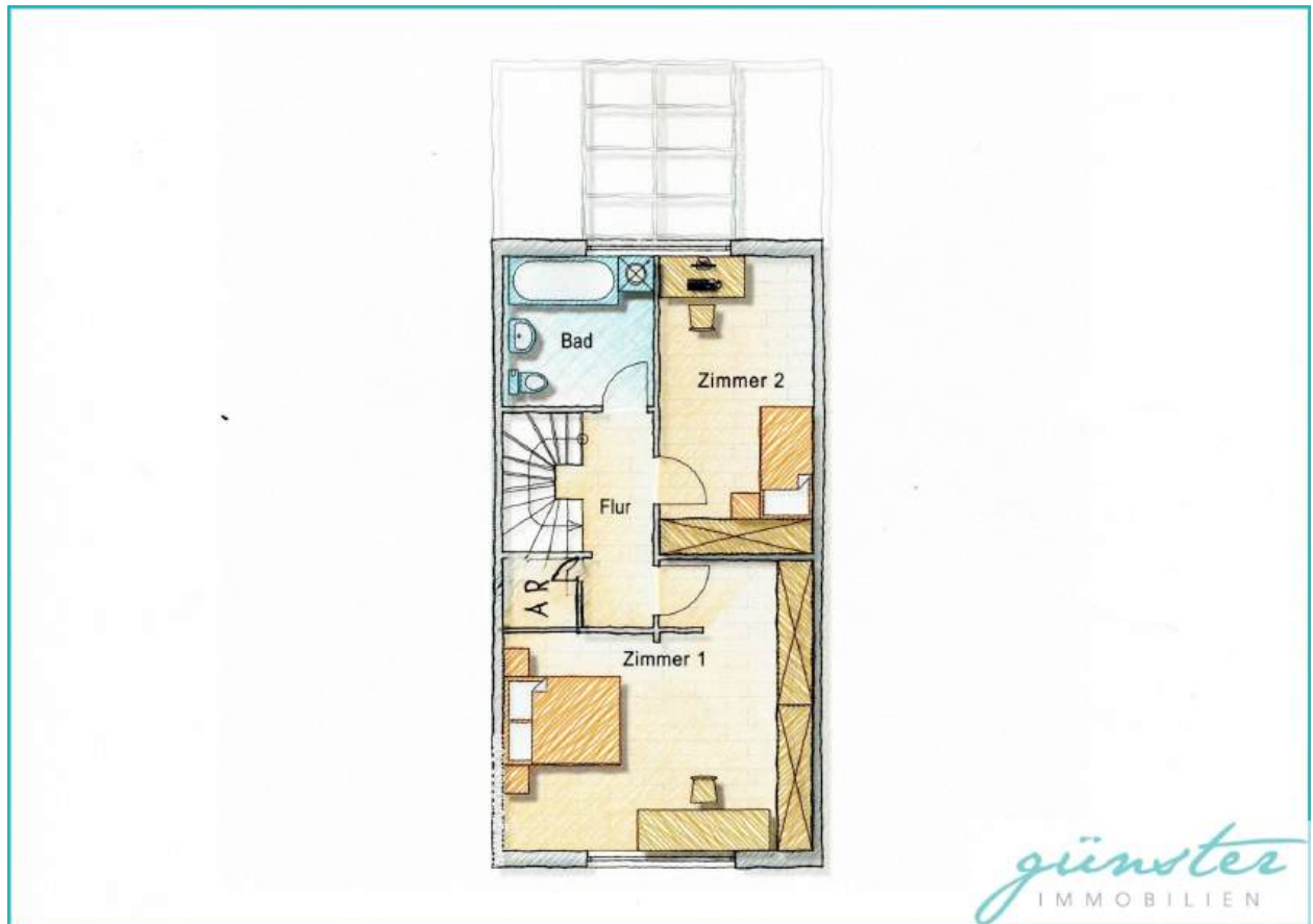
Grundriss OG - nicht maßstabsgetreu