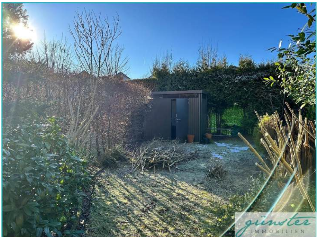
Garten mit Gartenhaus