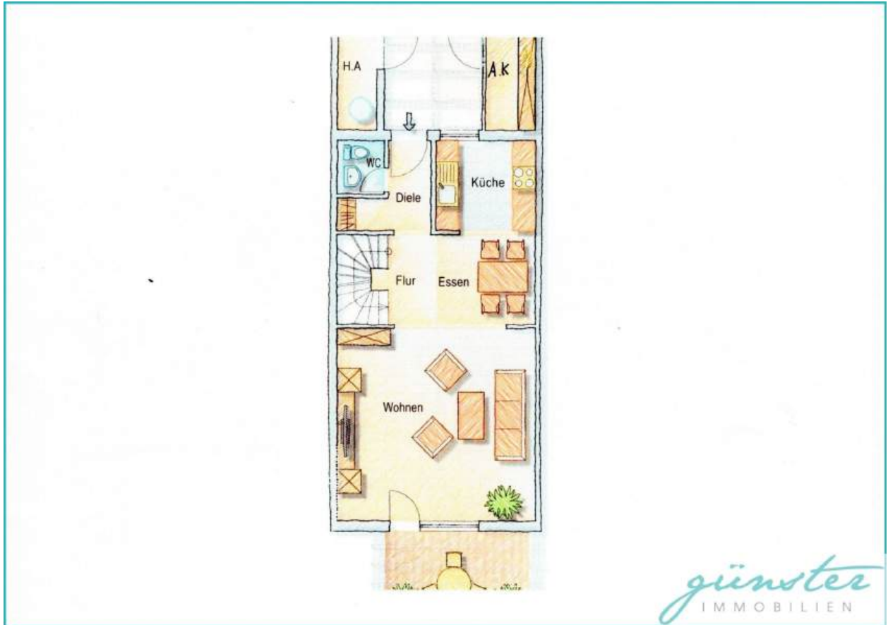
Grundriss EG - nicht maßstabsgetreu