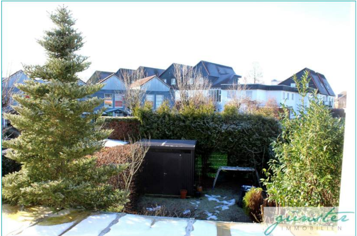
Gartenansicht von oben