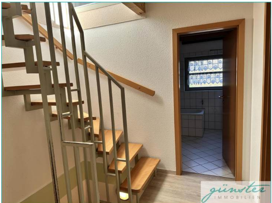
Treppenhaus ins Dachgeschoss