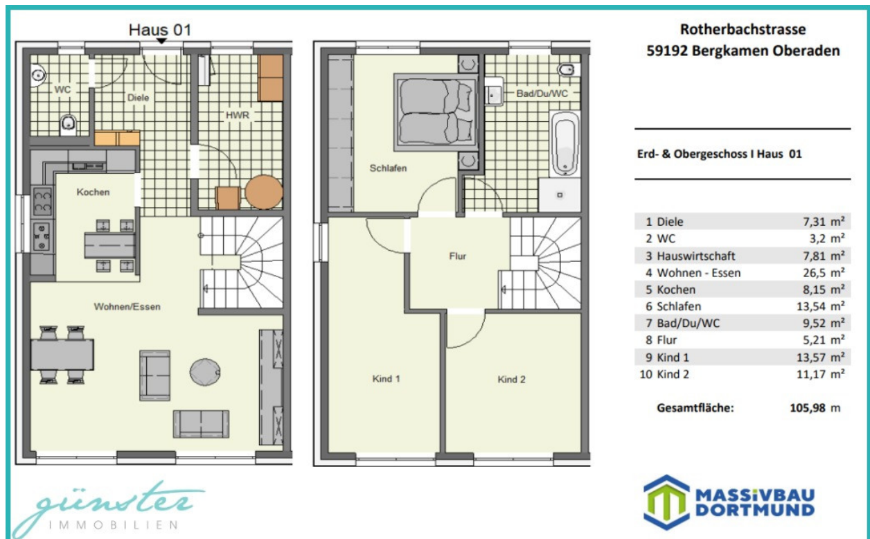
Grundriss Reihenendhaus 01+06 - nicht maßstabsgetreu

In direkter Nachbarschaft befinden sich Kamen, Lünen, Werne und Bönen (alle im Kreis Unna) und die kreisfreie Großstadt Hamm.