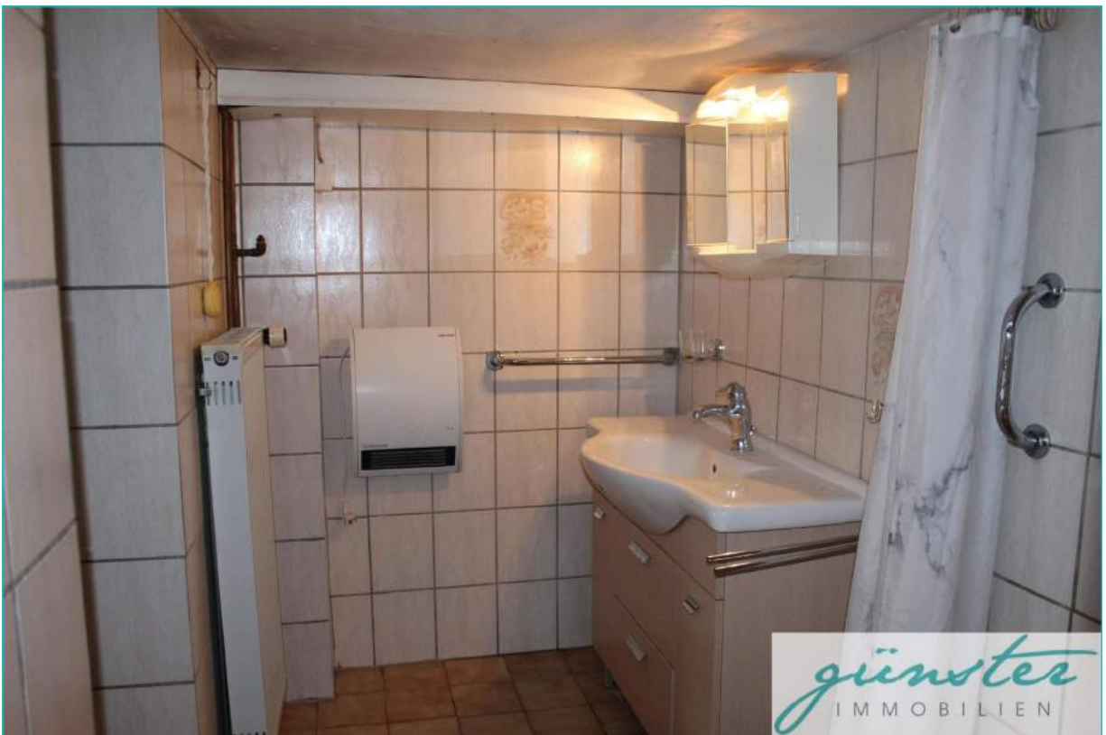
Bad im Keller