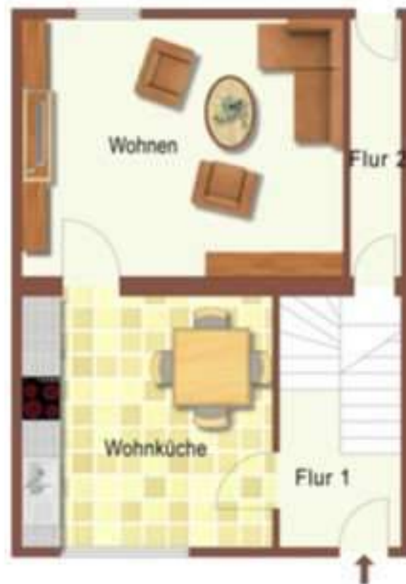
Erdgeschoss - nicht maßstabsgetreu