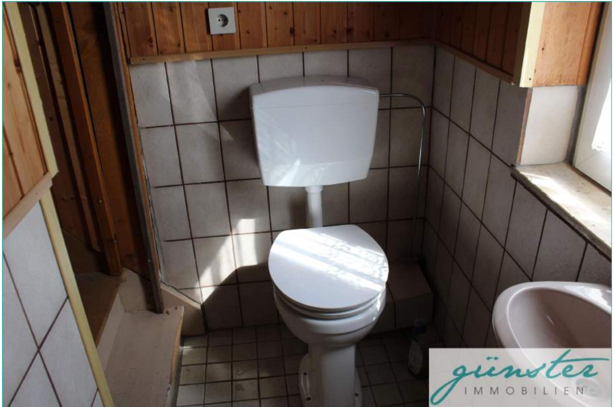
Toilette im Obergeschoss