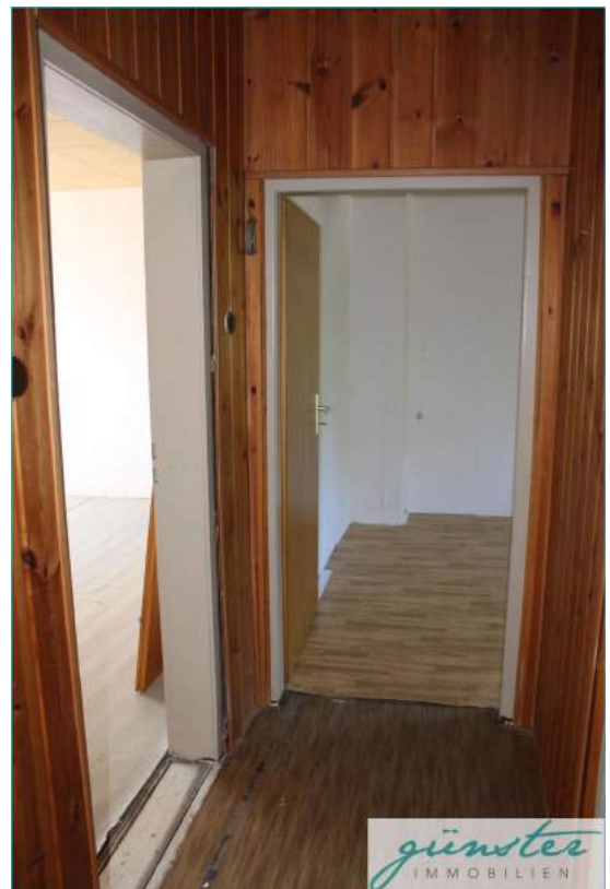
Flur im Obergeschoss