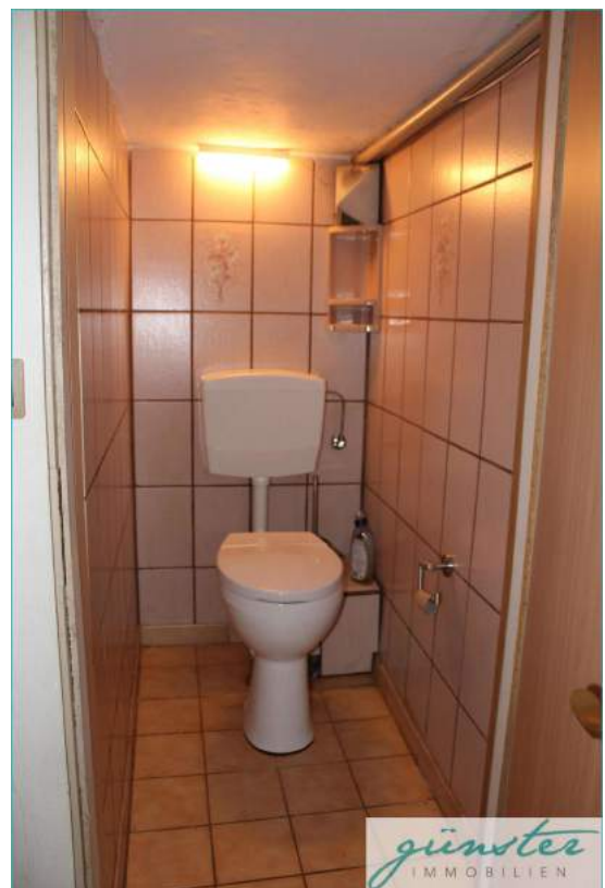
Toilette im Keller