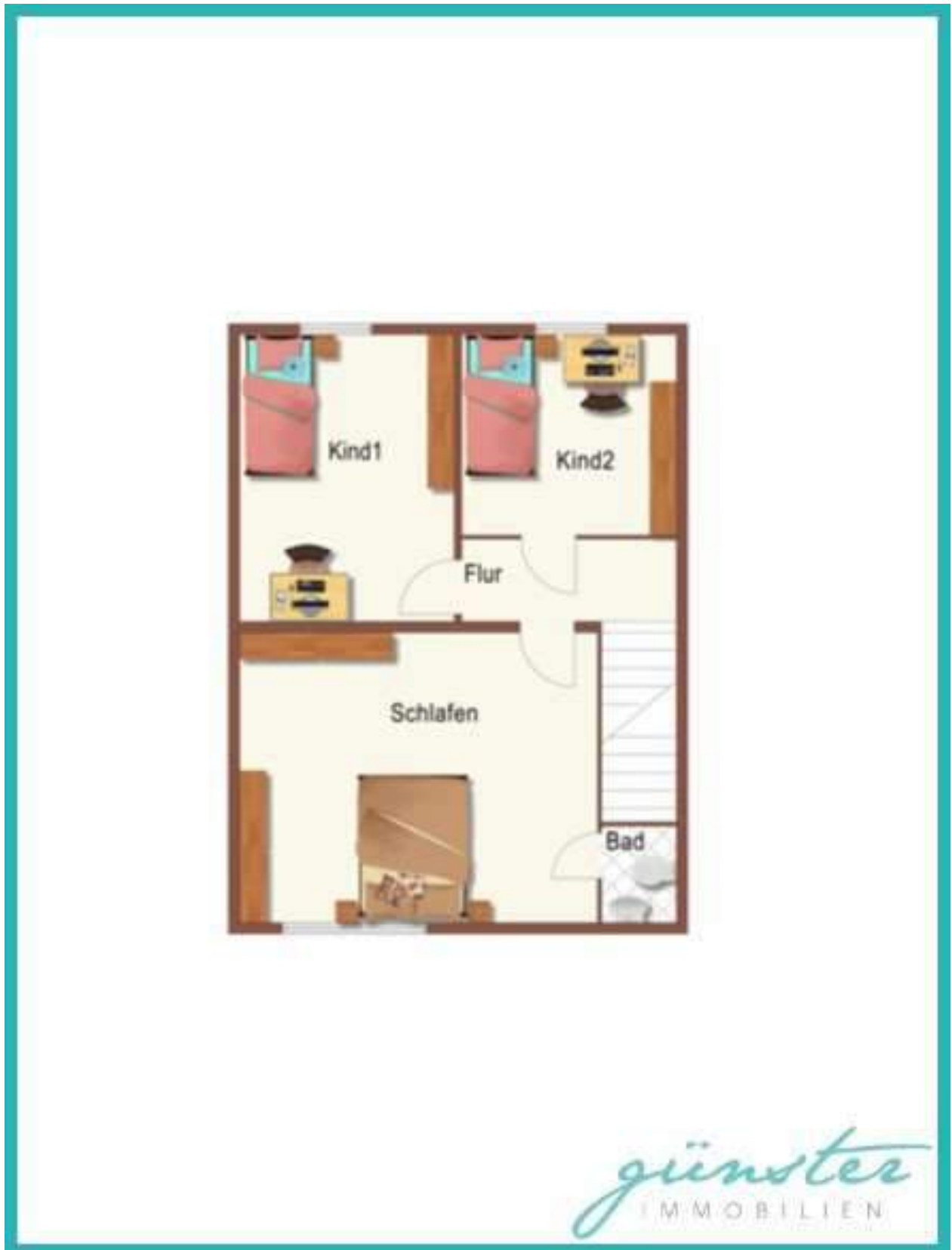
Obergeschoss - nicht maßstabsgetreu