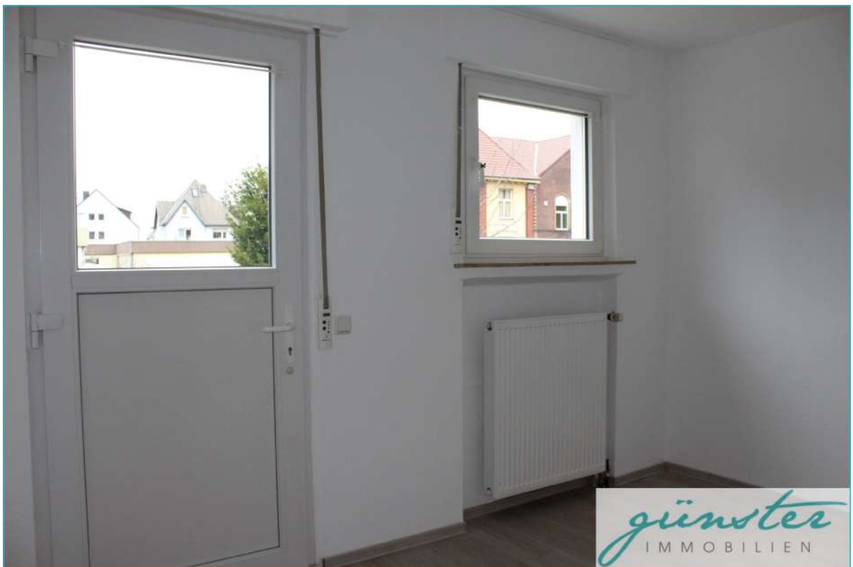
Küche mit Gartenzugang