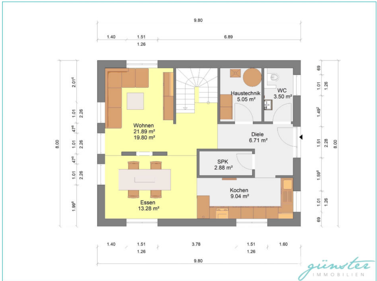
Grundriss EG - nicht maßstabsgetreu